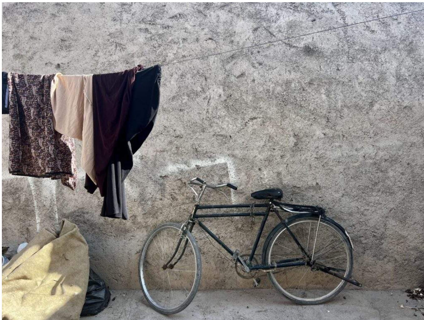
Iran, tra gli immigrati afghani.

Penso che questo caso sia simile a quanto accade per la Russia: un paese enorme, dalla storia molto lunga e a volte parallela alla storia occidentale, che vive questo alternarsi di allontanamento e avvicinamento all'Occidente sotto regimi repressivi che schiacciano la popolazione. In entrambi i casi si è sviluppata una coscienza popolare molto diversa che fa spesso affidamento alla cultura, alla letteratura come simboli di resistenza, spesso silenziosa ma attiva contro questi governi. Non siamo solo "noi" occidentali a essere contro le guerre e le dittature, ma non andando lì, non sapendo la lingua, non avendo approfondito queste culture, non ci accorgiamo che la realtà interna è molto più sfaccettata. Qui un punto di incontro spesso è proprio la cultura, la letteratura.