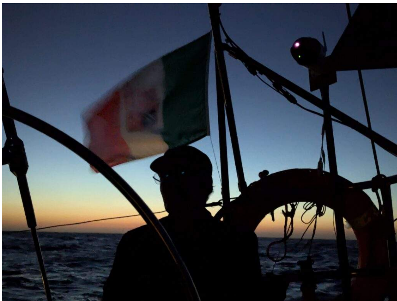
Un tramonto di settembre sul Mediterraneo.

più serrati sapendo che avremmo potuto essere intercettati da un momento all'altro; praticamente non si dormiva più. Ovviamente questa continua tensione e la privazione sistematica del sonno fanno parte di una strategia delle forze israeliane che è all'ordine del giorno nei territori occupati: in Cisgiordania gli israeliani bombardano con bombe sonore o lacrimogeni durante la notte. Noi abbiamo vissuto sulla nostra pelle per poco queste vere e proprie torture in carcere, quando i soldati entravano nelle celle di notte puntandoci contro le armi, non facendoci dormire, cambiandoci di cella ogni notte e mantenendo una tensione costantemente alta. Questa però è la realtà di tutti i giorni non solo a Gaza, ma anche in Cisgiordania: una situazione che ti fa sempre sentire in pericolo di vita anche se magari non lo sei.