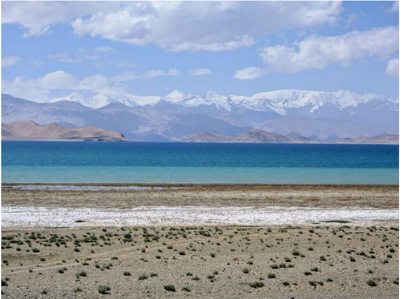
Gli sterminati spazi degli altopiani centroasiatici.

Iraq, Iran e Afghanistan sono tre paesi che spesso vengono mistificati dalla narrazione occidentale. Per gli americani non sono altro che le culle del terrorismo contemporaneo e non c'è curiosità di vedere come vivono davvero questi milioni di persone o come sia la loro società, al di là della retorica, orientalista o islamofoba che sia. Ovviamente il fatto che i popoli non siano il loro governo non vale quando si parla di persone non europee e non bianche.