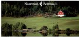
KARL OVE KNAUSGÅRD